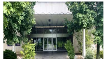
麦克纳白中学Sir Allan MacNab